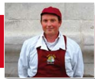
Macelleria Da Marco