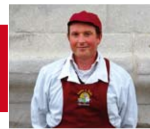
Macelleria Da Marco